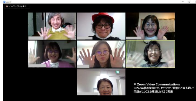
※画像はテスト時、ZOOM を活用した時のキャプチャー