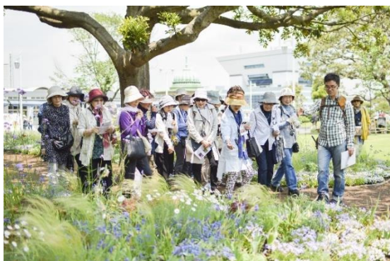
定番人気イベントの「草花散歩」

当社は、雑誌以外の事業にも力を入れています。企画から運営まですべて自社スタッフが行うオリジナルイベントを、年間約 200 回開催しています。最近話題の「きくち体操」等、雑誌「ハルメク」で人気連載を持つ方を講師に招いた講座も頻繁に開催しています。